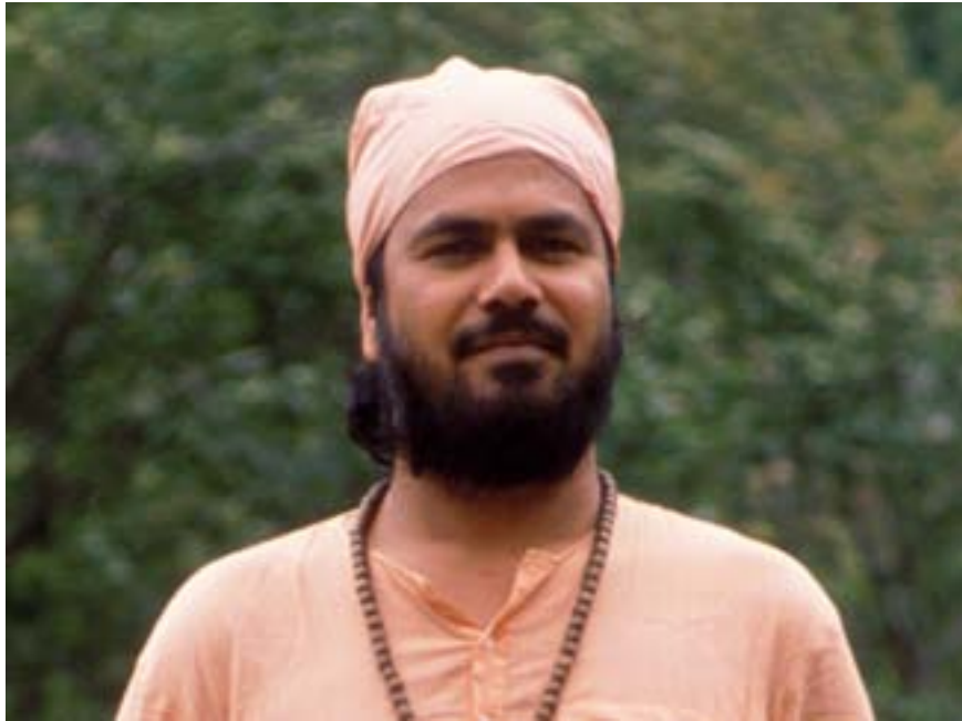
Swami Paramananda i Romsdal, august 1989.

Uke 43 * Stiftelsen Tronfjell Fredsuniversitet * 2021