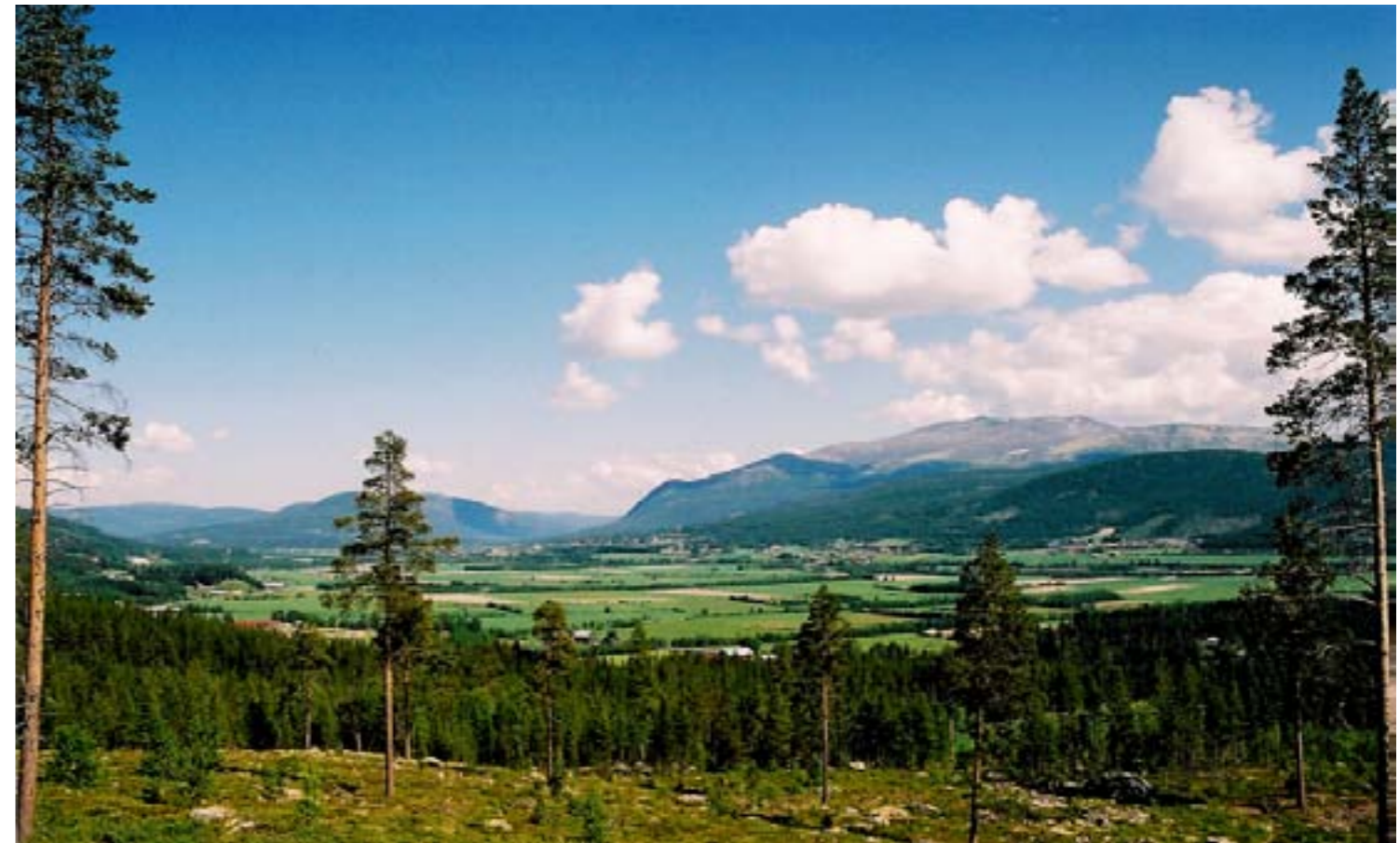
Tronfjell og Alvdalsbygda sett fra Valleråmoen.