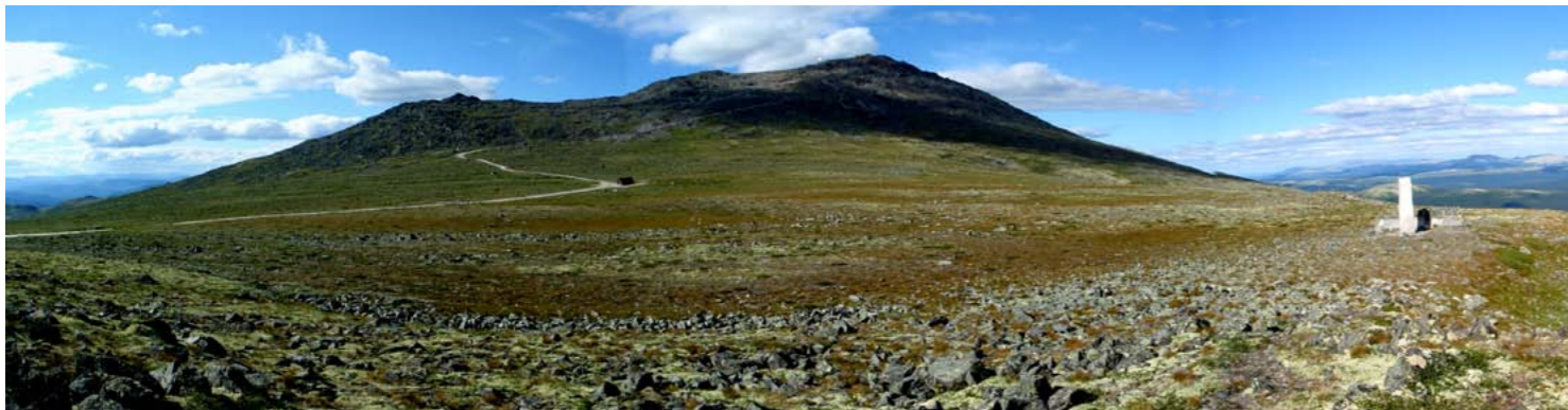
Panorama av Flattron ved minnesmerket over Baral og grunnsteinen til Fredsuniversitetet.