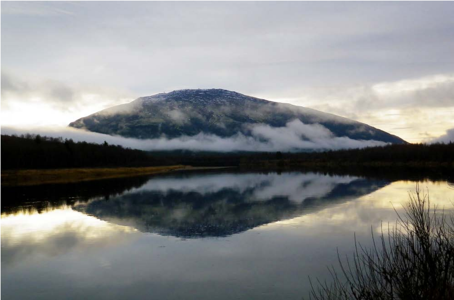
Tronfjell med Glåma i forgrunnen, sett fra Tynset kommune, like før kommunegrensa til Alvdal ved Auma, den 7. november 2011 kl. 10:54.