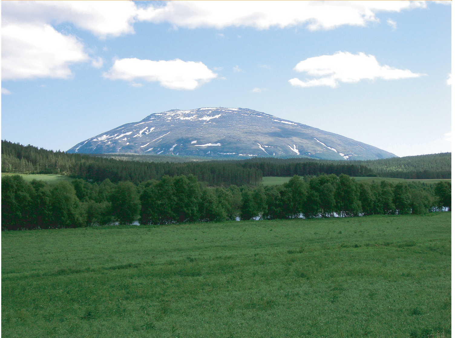
Tronfjell sett fra Tynset, med Glåma i forgrunnen, 18.juni 2007.

Juli 2007 • Stiftelsen Tronfjell Fredsuniversitet • Nr. 2 Årg. 10