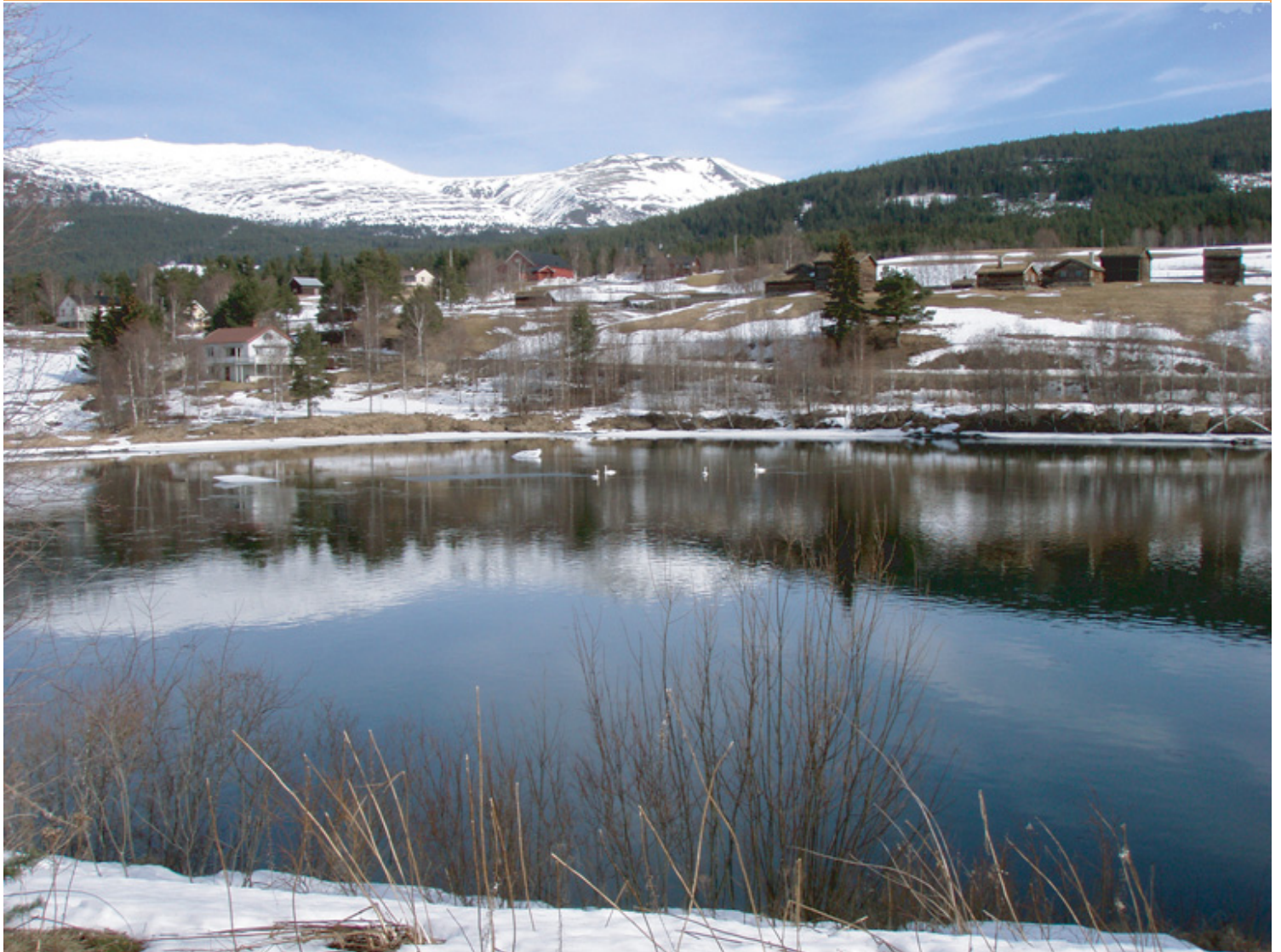
Tronfjell med Fredsplatået. I forgrunnen Glåma med fire sangsvaner, 31. mars 2007.

April 2007 • Stiftelsen Tronfjell Fredsuniversitet • Nr. 1 Årg. 10