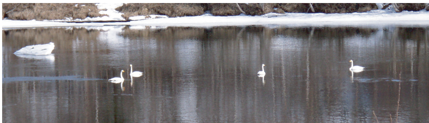
De fire sangsvanene fra forside fotografiet, zoomet inn tre ganger og forstørret.