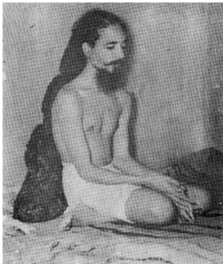
Balyogi i 1956. Legg merke til det store håret.