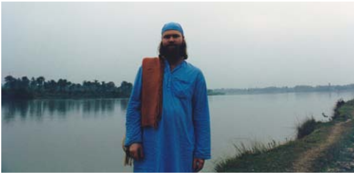
Forfatteren ved Bhagirati Ganga, Azim Ganj, desember 1994.