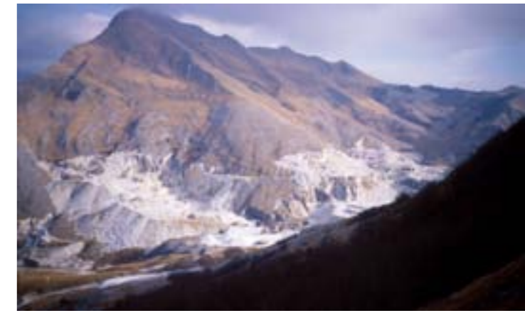
Noen av de åpne marmorbruddene i Carrara.