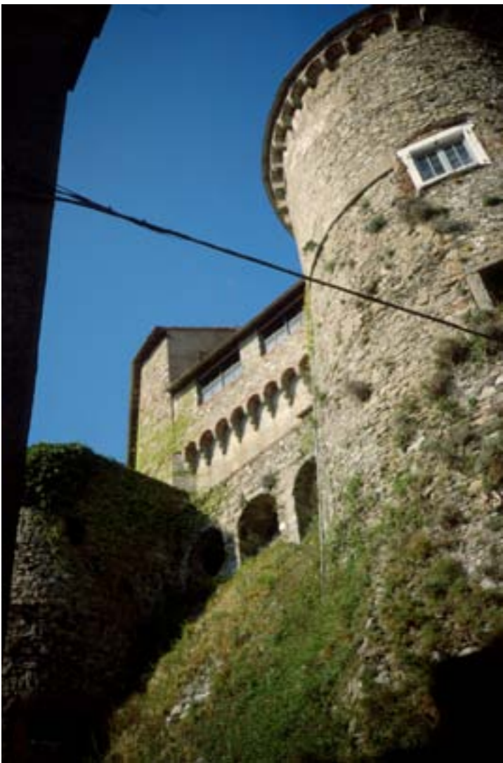
Over: Borgen i fjellene hvor vår kvinnelige guide fortalte den grusomme historien.