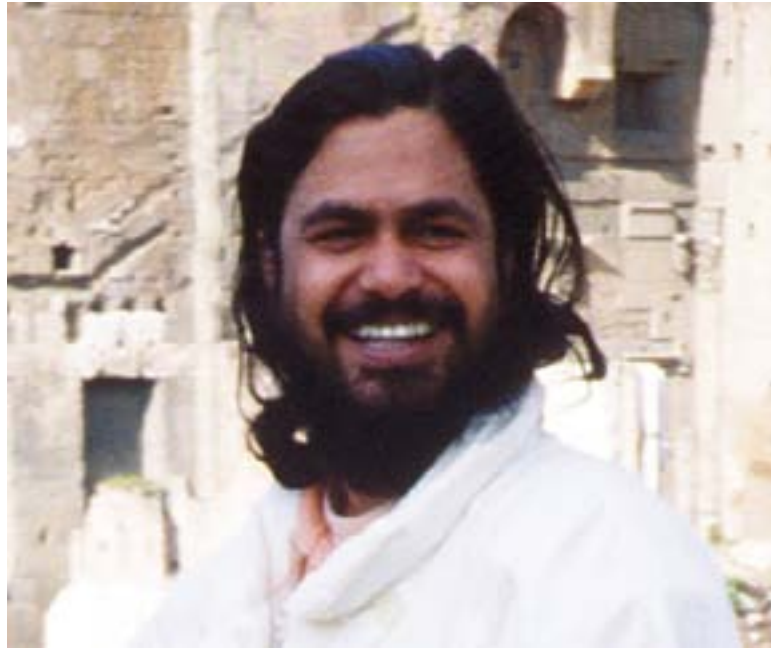
Swami Paramananda i Italia, 1989.

Uke 45 * Stiftelsen Tronfjell Fredsuniversitet * 2021