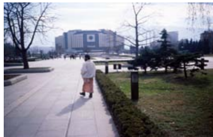
Paramananda går mot den store offentlige bygningen tidlig om morgenen, hvor vi kunne stille oss litt, Sofia, Bulgaria.