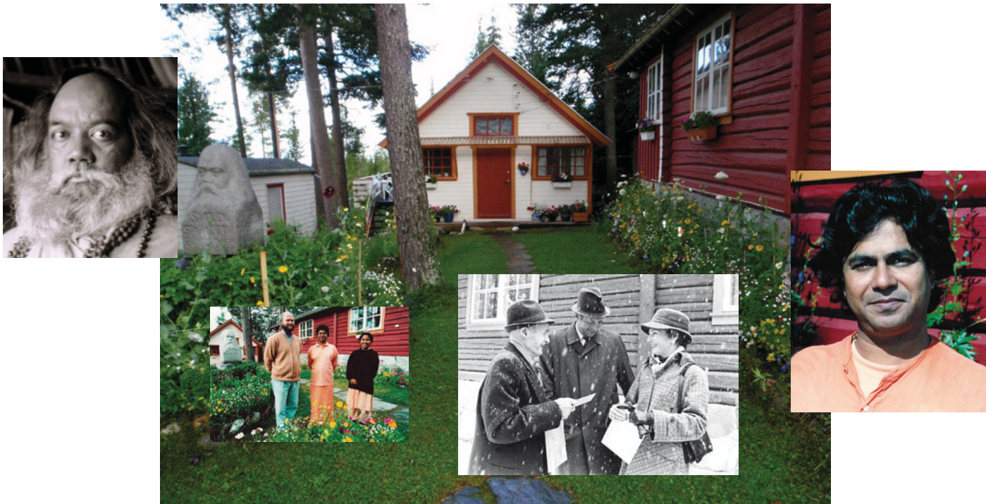
Shantibu i Alvdal, 27.07.2010