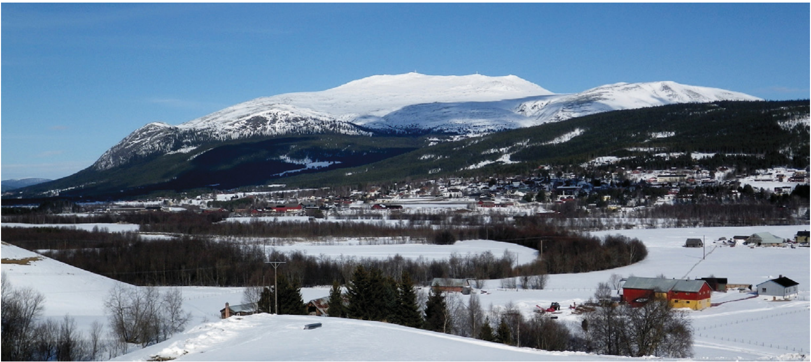
Over: Sør-vest siden av Tron (Alvdal), 15.03.2011. Under: Nord-vest siden av Tron (Tynset), 13.07.2009.