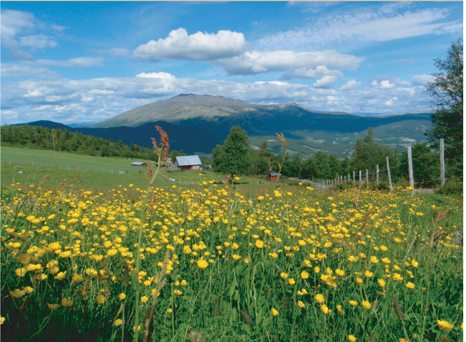
Tronfjell sett fra Åsvangan i sør-vest, 5. juli 2010.

September 2010 • Stiftelsen Tronfjell Fredsuniversitet • Nr. 2 Årg. 13