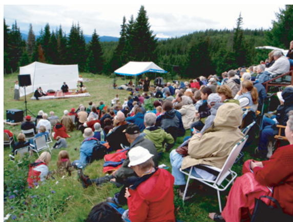
Til høyre: Fra uroppførelsen på Tronsvangen.