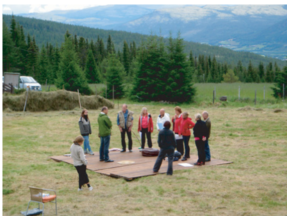
Til venstre: Fra prøvene på Tronsvangen, 04.08. 2010.