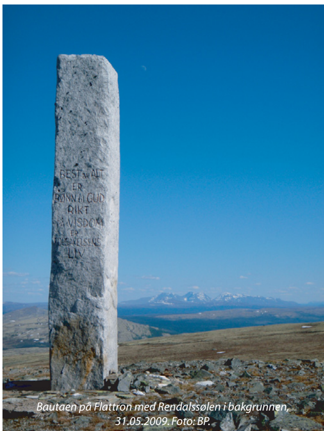
Bautaen på Flattron med Rendalssjøen i bakgrunnen, 31.05.2009.