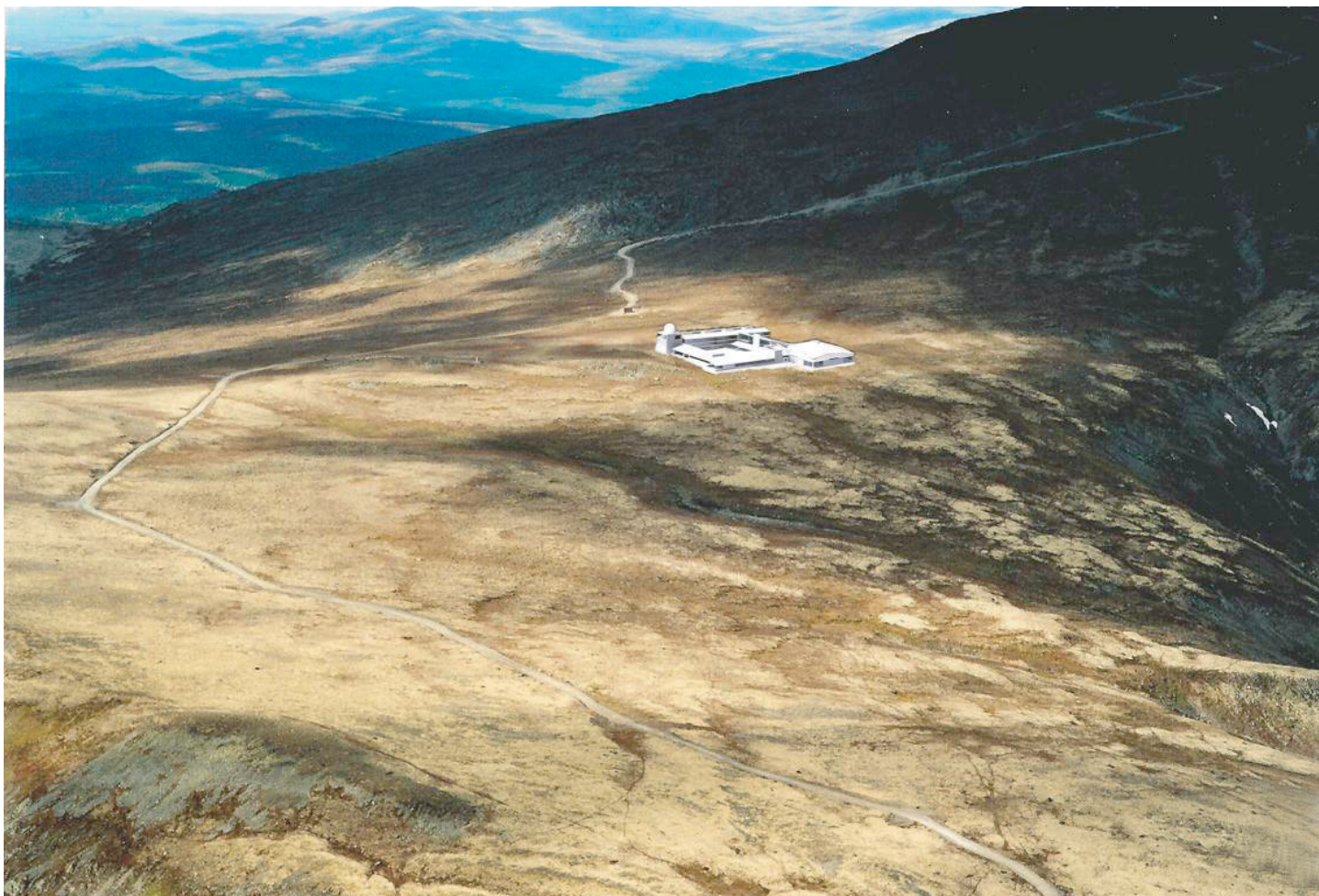
Modell av Tronfjell Fredsuniversitet manipulert inn i et flyfoto, riktig plassert på Flattron.

En avklaring på om Stiftelsen faktisk får godkjent tomt og byggetillatelse på Tronfjell for Fredsuniversitetet, nærmer seg nå raskt, og det er tid for en kort oppsummering av et prosjekt som av forskjellige årsaker har tatt tid, da flere nå sikkert har mistet oversikten underveis.