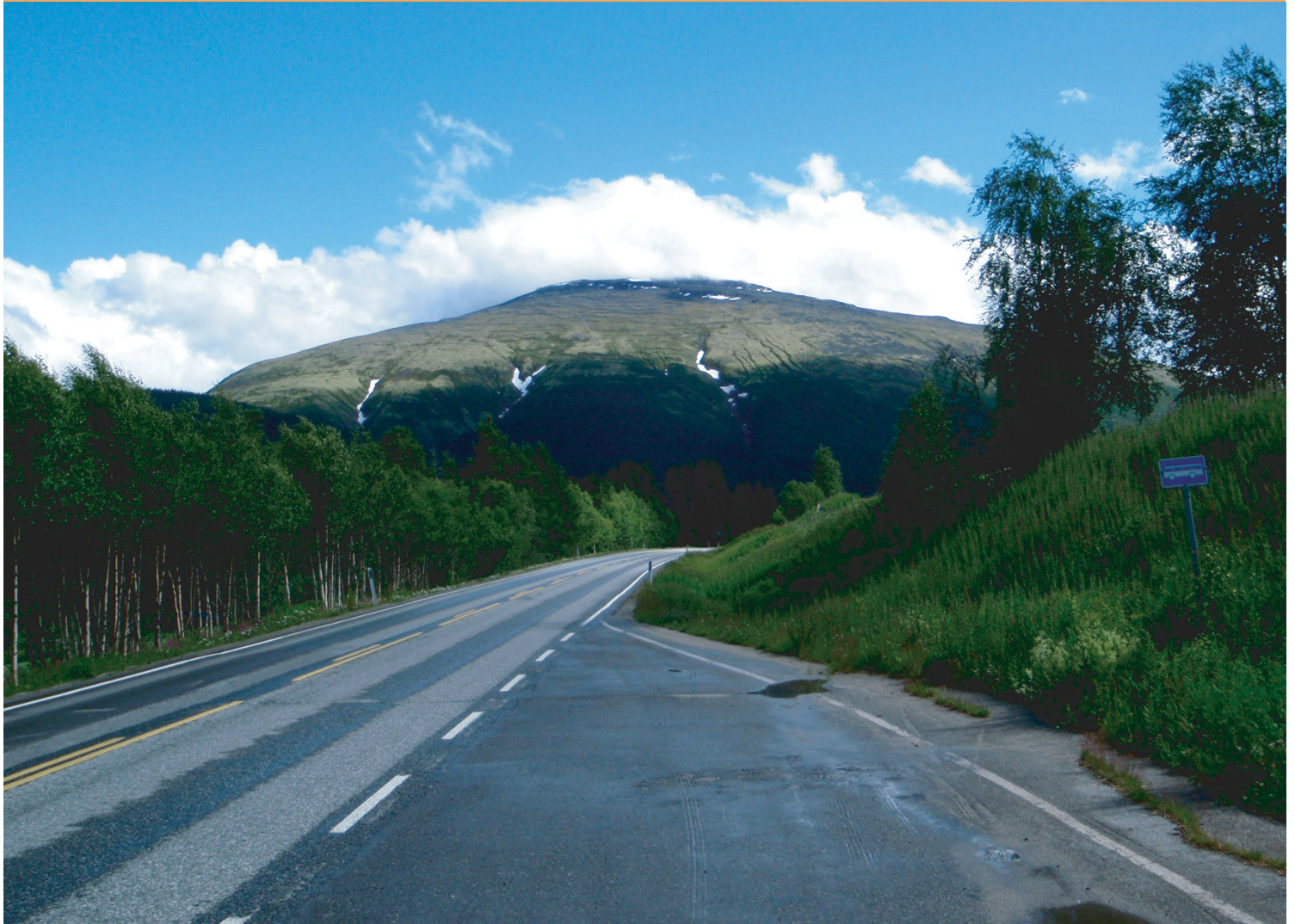
Tronfjell sett fra Rv3 ved Auma, på kommunegrensa mellom Tynset og Alvdal, 15. juli 2008.

November 2008 • Stiftelsen Tronfjell Fredsuniversitet • Nr. 3 Årg. 11