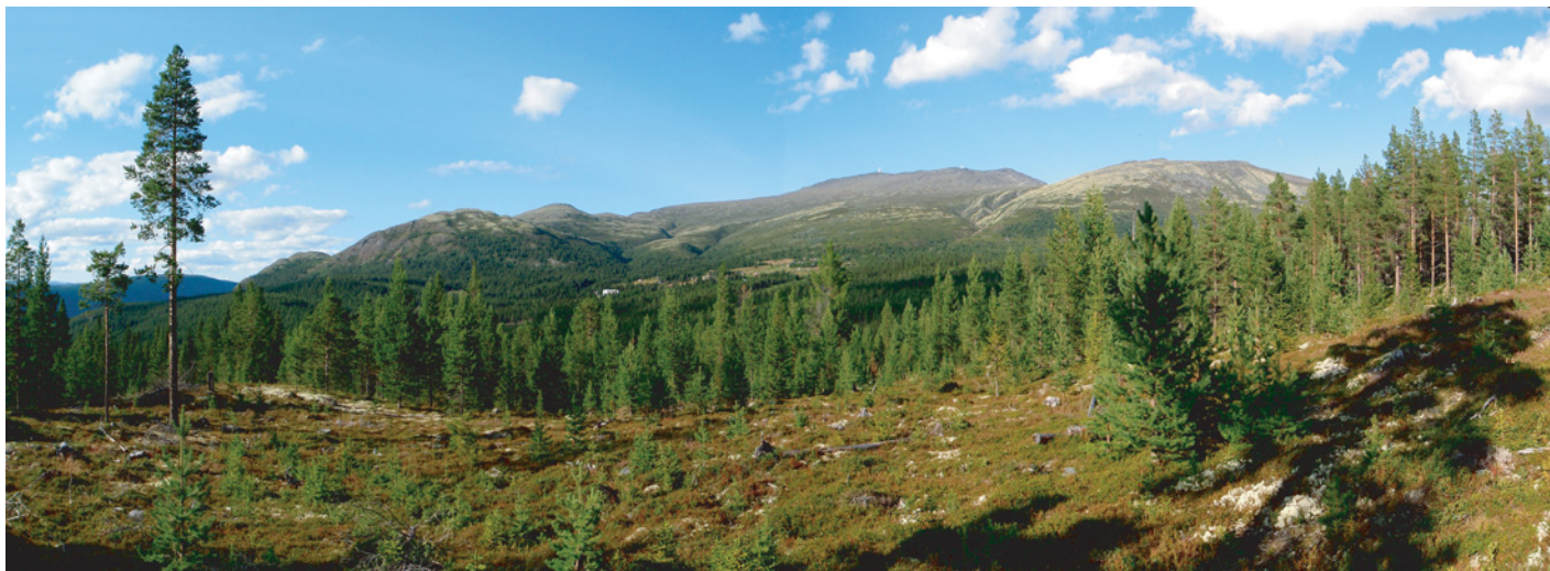
Panorama av Tron sett fra Tronsvanglia, 24. august 2008.

Hvis du vet at du ikke er din fysiske kropp, og at du ikke er noe av alt det som ditt sinn inneholder, verken dine tanker, følelser, ønsker eller viljer, men at alle disse bare er noe du har for å kunne oppleve livet. - Hvis du erkjenner, at selv om alle dine kroppsceller er blitt byttet ut og fornyet mange ganger, og selv om du har forandret, mening, holdning, følelser og kanskje til og med natur mange ganger i løpet av livet, har aldri din "jeg-følelse" bakenfor alt noen gang forandret seg - fordi du føler deg som akkurat den samme i dag som du alltid har gjort så lenge du kan huske. - Hvis du opplever at du, til tross for sterke oppturer og nedturer, motgang og medgang, sorger og gleder i livet, ikke lar deg rive med eller bli veltet overende, men beholder roen og oversikten, og samtidig erfarer at livet ditt blir mer og mer fokusert og bevisst. - Hvis du elsker Gud (Altet - det Absolutte), ditt Selv og din neste (alle levende vesener) like høyt og av hele ditt hjerte og hele ditt sinn og all din sjel. - Ja, da realiserer du ditt Selv og nyter fritt dette evigforundrende livet!