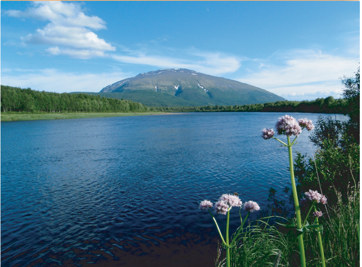
Tronfjell en klar sommerdag, sett fra Tynset med Glåma i forgrunnen, 9. juli 2008.

August 2008 • Stiftelsen Tronfjell Fredsuniversitet • Nr. 2 Årg. 11