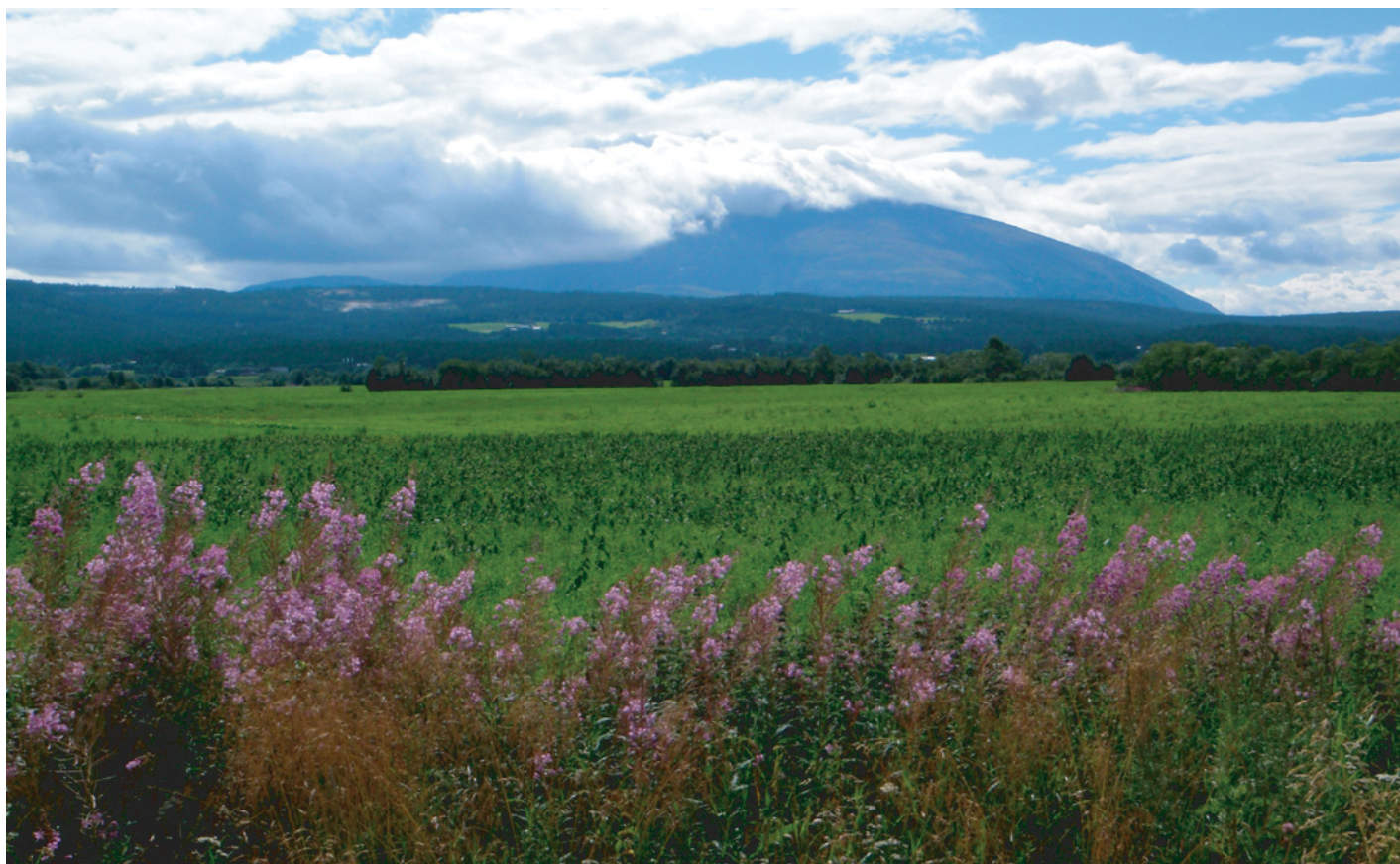
Tron delvis innhyllet i dramatiske sommerskyer, sett nær Tynset sentrum 6. august 2008.