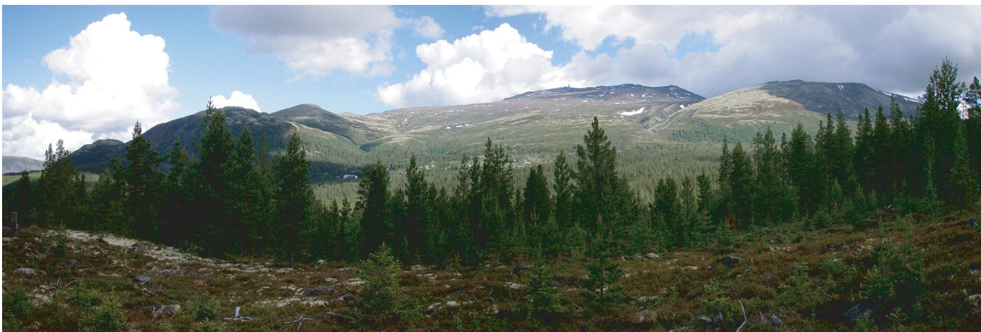
Panorama av Tron sett fra Tronsvanglia, 16. juni 2008.

En god mor som er like glad i alle sine barn og ikke gjør forskjell på dem, og som er glad i sine venners barn og i sine barns venner, viser åndelighet, mens en stor 'guru' ('åndelig veileder') som føler seg høyt hevet over og holder avstand til alle andre, er fjernt fra det. Og en som alltid er innstilt på å hjelpe sine medmennesker og gjerne ofrer sine egne goder til fordel for andre som trenger dem mer, viser åndelighet, mens en dogmatisk religiøs leder eller en karismatisk synsk healer som drar fordeler av andres uvitenhet og nød, er langt borte fra all åndelighet. Åndelighet er innsyn, vidsyn og medmenneskelighet. Uten vanlig medmenneskelighet er det ingen åndelighet.