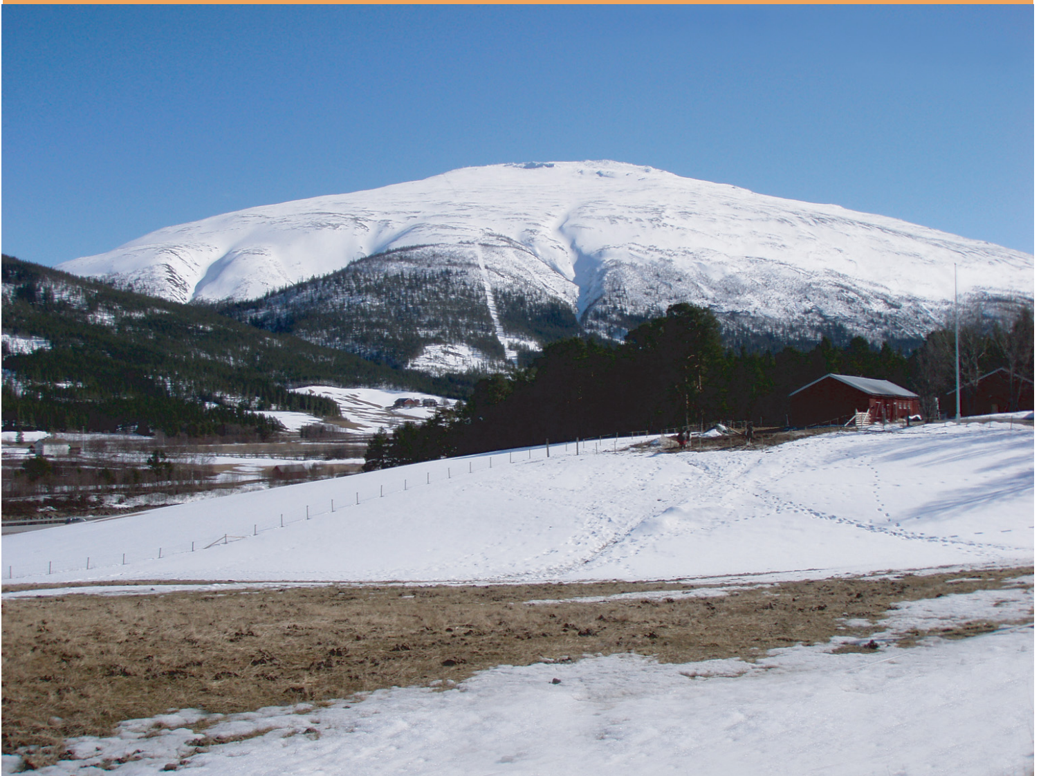
Tron sett fra Strømmen, Alvdal, 18. april 2008.

Mai 2008 • Stiftelsen Tronfjell Fredsuniversitet • Nr. 1 Årg. 11