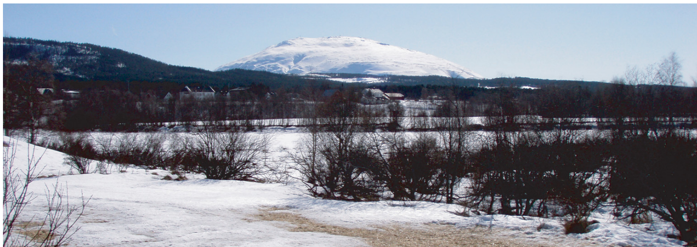
Tron sett fra sentrum av Tynset, 17. april 2008.

I all vestlig litteratur og kulturtradisjon brukes de tre begrepene 'sjel', 'sinn' og 'ånd' om hverandre - det er ingen egentlig distinksjon mellom dem. Sammen med uttrykk for 'Gud' er de alle svært vage begreper som ikke gir oss klare idéer om meningen bak. I Østen er dette helt annerledes, der er det krystallklare skiller mellom alle disse begrepene; som for eksempel mellom menneskets sinn og dets atman ('sjel'). Der er mennesket identifisert og kartlagt ned til minste detalj - både fysisk, mentalt og åndelig - for allerede flere tusen år siden. Mens i Vesten er alt som har med naturvitenskap, politikk, organisasjon og økonomi å gjøre høyt utviklet. Alt dette forteller oss om forskjellene i interesse og identifikasjon mellom Østen og Vesten, og bekrefter gyldigheten av den gamle historien fortalt innledningsvis.