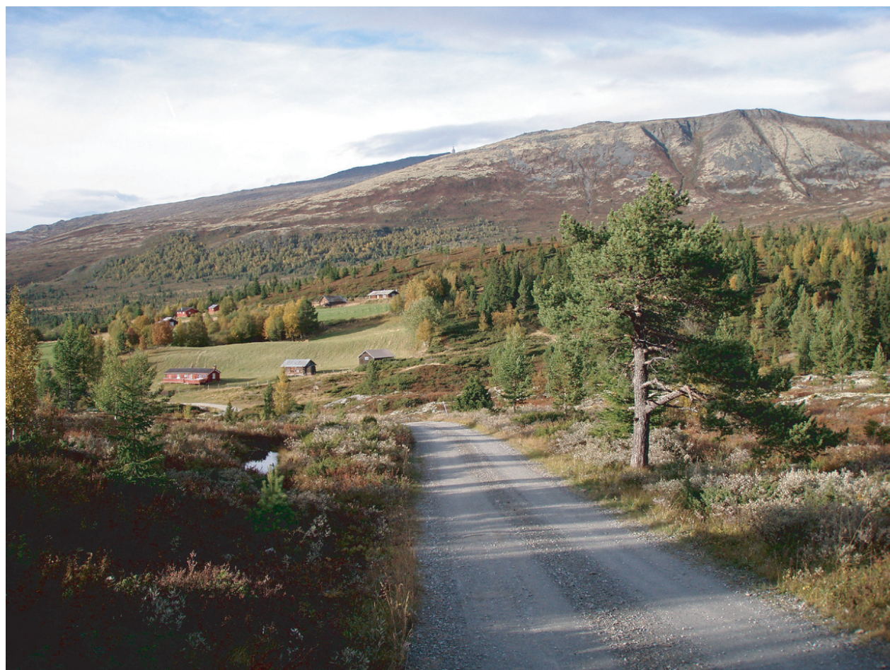
Tron med toppen (Blåskarven) lengst bak og Sørkletten i forgrunnen, sett fra Nysetervangen, 11. september 2007.