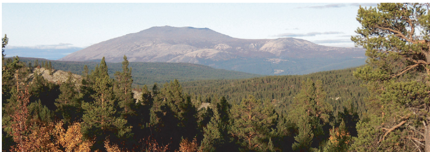
Tron sett fra Sølndalen i Alvdal Vestfjell, 27. september 2007.

Mennesket lever nå i en 'global landsby' og kan ikke lenger følge sine lavere drifter og instinkter. Det må våkne opp til sine høyere kvaliteter og virkelig vise hva det vil si å være menneske - hva det vil si å kunne realisere seg selv fullt ut. I en 'landsby' hvor alle etterhvert vil kjenne alle, vil enkeltmennesket få sitt rettmessige verd og sin naturlige betydning. Hvert menneske er en unik manifestasjon - det eneste uttrykk i sitt slag for den evige livsutfoldelse. Det er et mikrokosmos i makrokosmos, dvs. at det er ingenting der ute som ikke også er her inne - inne i oss alle sammen. Hvert individ er som en stråle fra Livets sol eller som en bølge på Altets hav. Vi er like i essens og hører sammen. En verdensregjering sprunget ut fra De Forente Nasjoner og dets menneskerettighetserklæring, hvor supermakter og hevn forbyr, vil i dag trolig være den beste begynnelse og håp for en verdensvid politisk fred og stabilitet i framtiden.