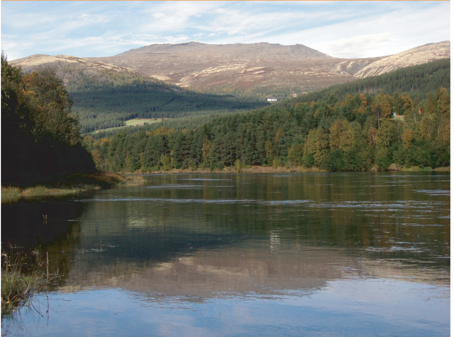
Tronfjell ruver over Alvdal (ca. 1190 meter over der fotografen står), mens Glåma renner stille i dalbunnen, 11. september 2007.

November 2007 • Stiftelsen Tronfjell Fredsuniversitet • Nr. 4 Årg. 10