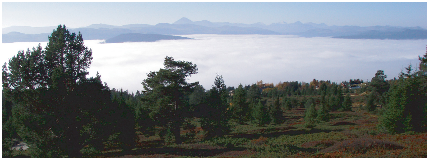
Utsyn fra Tronsvangen mot Rondane, 16. oktober 2006. Alvdal ligger gjemt i tåkehavet mens Tronsvangen ligger badet i høstsola.

Mennesket er alt og har alt, men vet det ikke. Det er sitt eget livs arkitekt og 'sin egen lykkes smed', og 'som det sår høster det'. Vi er selv årsak til krig og fred, og nøkkelen til selve Livets mysterium.