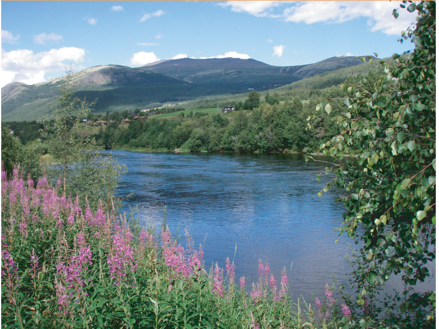
Tronfjell sett fra Alvdal ved Aukrustsenteret, med Glåma i forgrunnen, 3. august 2007.

September 2007 • Stiftelsen Tronfjell Fredsuniversitet • Nr. 3 Årg. 10