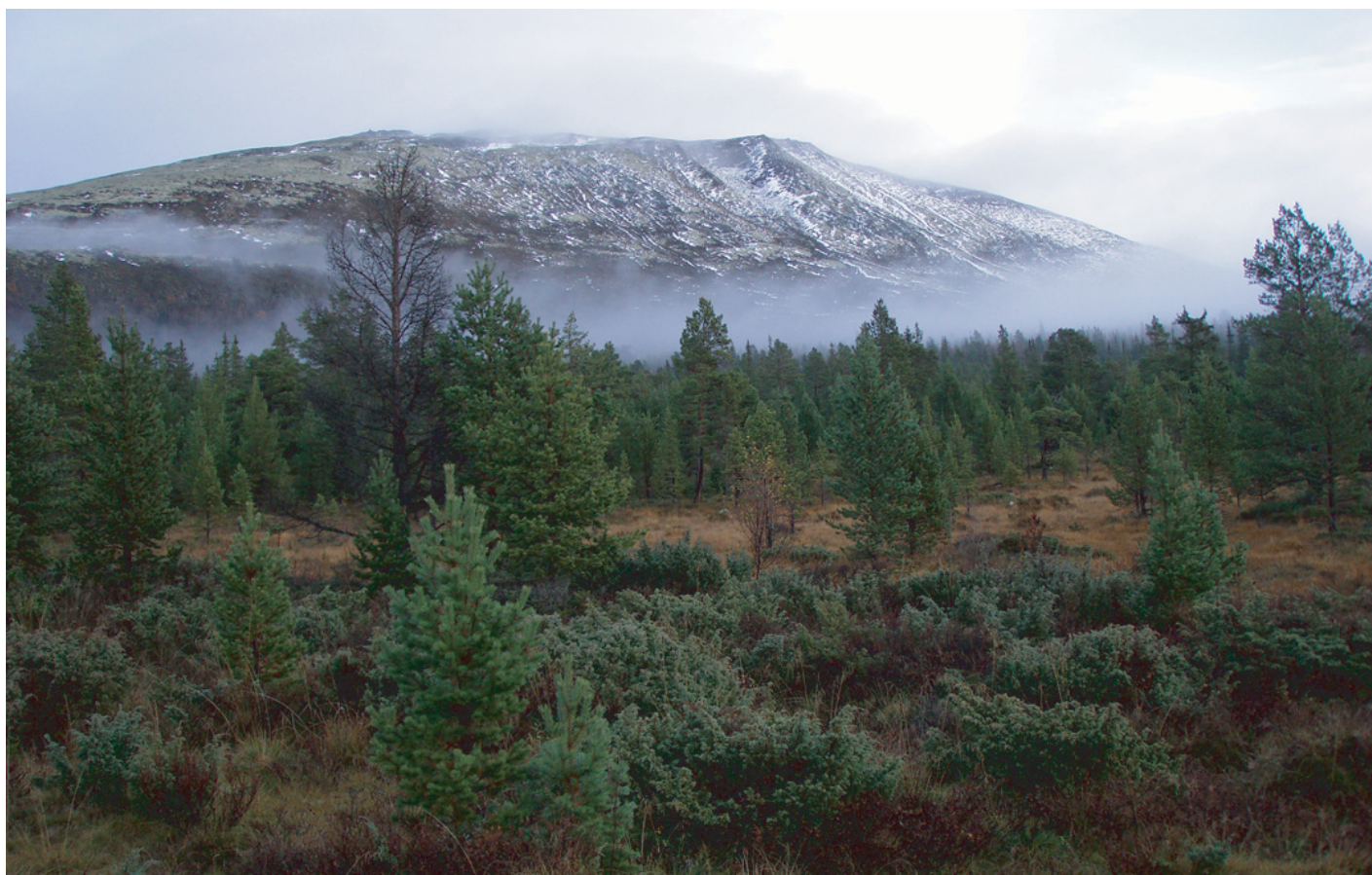
Det stunder mot vinter... Sørkletten på Tron har fått nysnø, 22. oktober 2006.