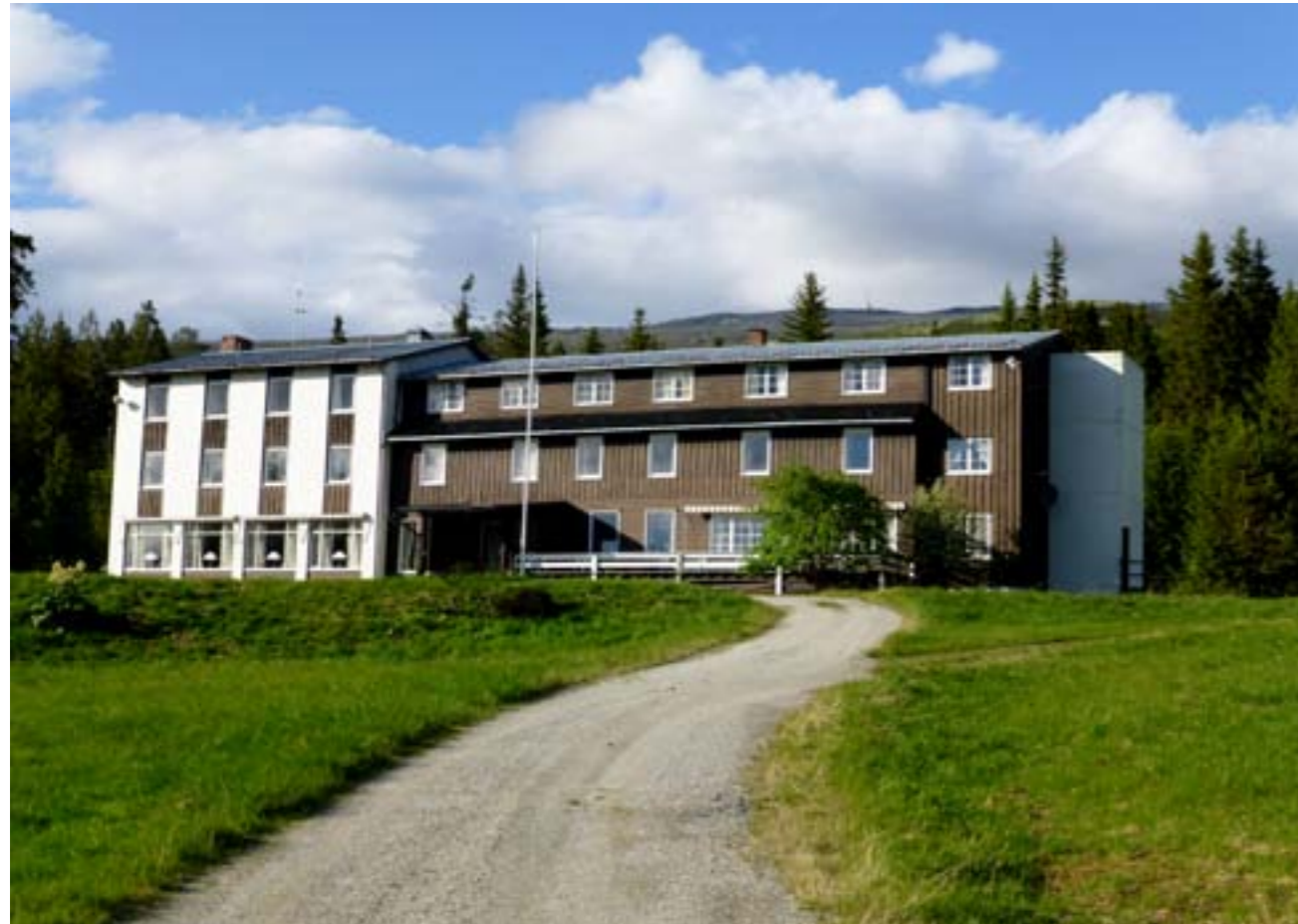
Tronsvangen Seter på Tronsvangen i Alvdal.

Den 10. januar i år ble Tronsvangen Seter Drift AS registrert i Frivillighetsregisteret hos Brønnøysundregistrene . Dette er ikke vanlig for et aksjeselskap, men ved en forandring i vedtektene ble det mulig. Selskapets vedtekter § 3, annet og tredje ledd, viser hvorfor: