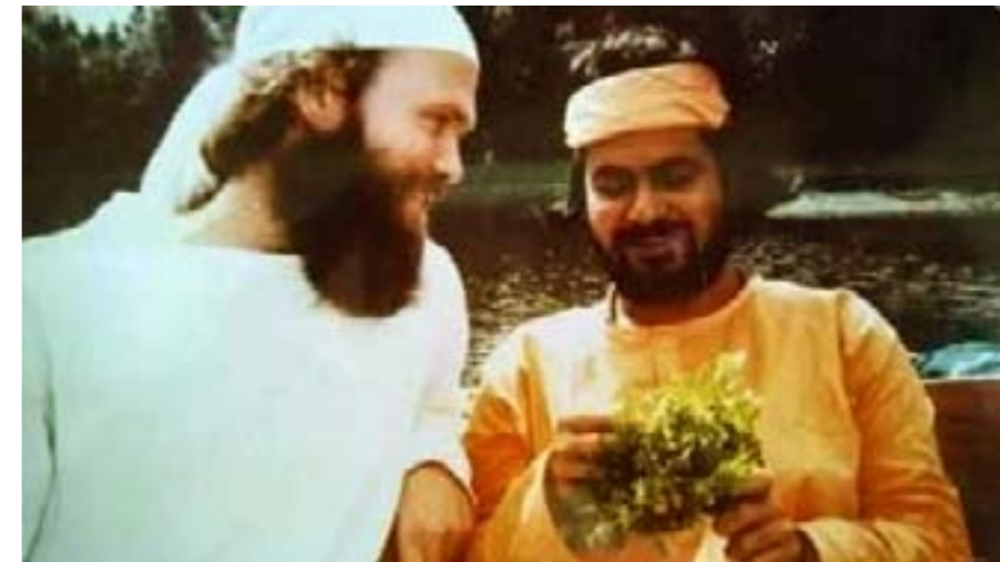
Bilde på bokas framre omslagsside.

Siste uka i juni (uke 26) i 2021 begynte utgivelsen av en spesialutgave av Tronfjellposten. Den utkom på torsdager i hver eneste uke med tilsammen hele 35 numre fram til siste uka i februar (uke 9) i 2022, og hadde samme tittel og innhold som nærværende bok.