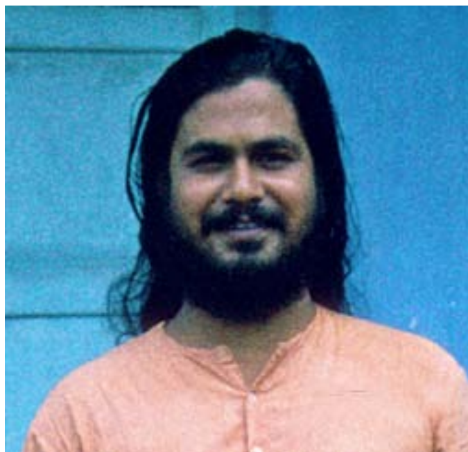
Swami Paramananda i Ranchi, Bihar, 1983.

Uke 4 * Stiftelsen Tronfjell Fredsuniversitet * 2022