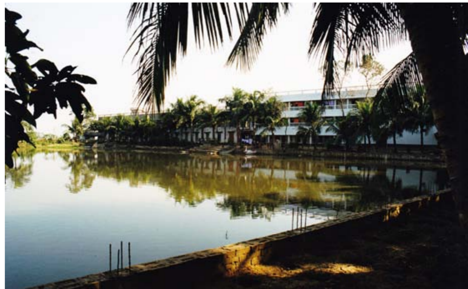
Under: Parti fra den store dammen med kjøkkenet, spisesalen og Sadhu Bhavan (rom for alle sannnyasins) i bakgrunnen. desember 1999.