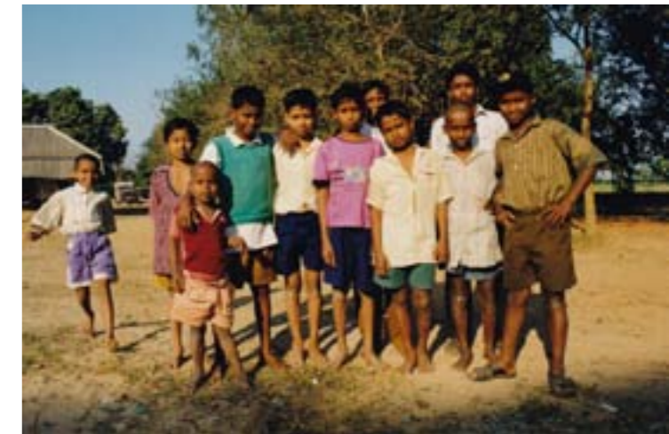
Flere glade barn i Banagram Paramananda Mission. Øverst til venstre: Den store, åpne lekeplassen ved det gamle banyantreet. Øverst til høyre: Foran den gamle skolebygningen. Over til venstre: Ved inngangen til Paramanandas hytte. Over til høyre: på lekeplassen.