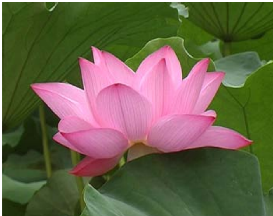
Lotusblomsten er fantastisk vakker og har stor symbolverdi i India. På den tiden var jeg enormt fascinert av lotuser, og kjøpte alle postkort med lotusmotiver jeg kunne komme over. Denne er imidlertid fra Kina i 2005.

Senere lærte jeg at denne type visjon tilhører den tredje og sterkeste grad av visjoner hvor visjonsobjektet for observatøren blir fullstendig levende og tredimensjonalt virkelig i denne fysiske, «vanlige» verden, og observatøren kan handle som en deltager om han vil. Men det han ser er naturligvis bare synlig for ham, og ikke for andre som måtte være rundt ham, selv om det mentale og det fysiske vil fremstå som ett for observatøren. Slik som for eksempel Ramakrishna gjorde med Moder Kali og Krishna-barnet, som han samtalte og lekte med på samme måte som med vanlige mennesker.