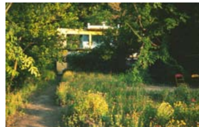
Ashramen i Rishikesh lå skjult og litt avsides til inne i jungelen. Utsikten over Gangesdalen og de skogkledte åsene opp mot Himalaya, var upåklagelig. Foto: BP 1983.

Jeg ble i denne ashramen i 81 dager – fra 27. september til 16. desember – men ba aldri om å få bli innviet av Swamiji. Likevel lærte jeg selvsagt mye, ikke bare yoga, men mest av alt beinhard disiplin. Hver dag der var en prøvelse til det ytterste av ens bæreevne og toleranseevne, med utallige konfrontasjoner i forhold til inngrodde «vestlige vaner» og «dårlige» personlige tilbøyeligheter som måtte rykkes brått og brutalt opp med roten. Ofte følte jeg at jeg hadde havnet i et galehus, og hver natt gråt jeg meg i søvn, fullstendig utslitt etter en lang og hard arbeidsdag, hvor alt jeg hadde gjort hadde vært feil og gjenstand for ubehagelig kjeft og irettesetting. Likevel tvang jeg meg selv til å bli fordi jeg tenkte at det på en eller annen måte måtte være bra for meg. Og selvfølgelig var det positive situasjoner og opplevelser innimellom som til en viss grad føltes oppveiene for mye av det negative. Men da jeg til slutt reiste, på dagen etter min fødselsdag, følte jeg en enorm lettelse over endelig å være fri igjen.