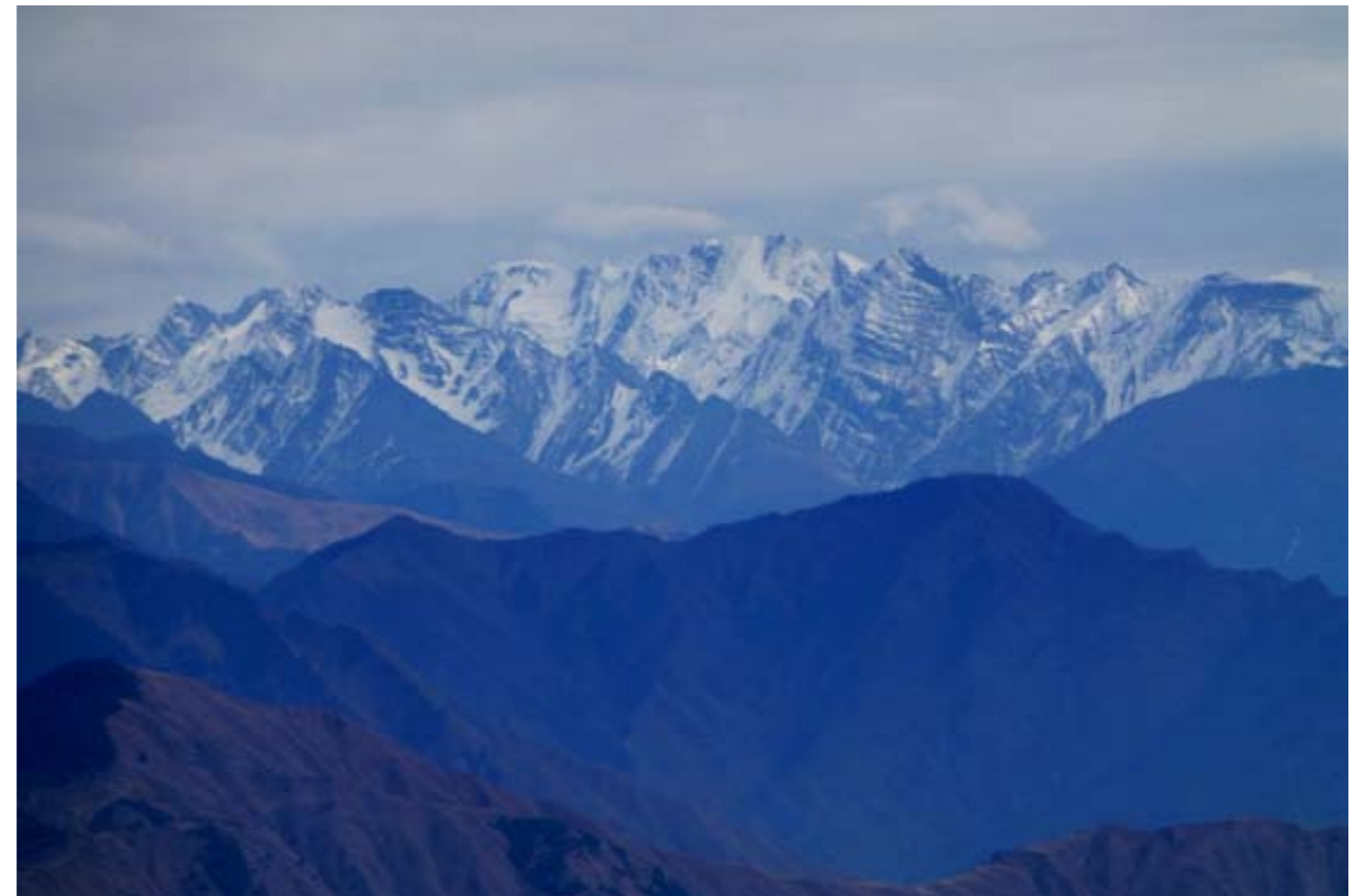
Utsikt fra områdene rett ovenfor Dalhousie, som ligger ca. to kilometer ovenfor Baniketh.