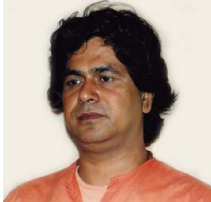
Swami Paramananda, Shantibu, Norge 1993.

Uke 39 * Stiftelsen Tronfjell Fredsuniversitet * 2021