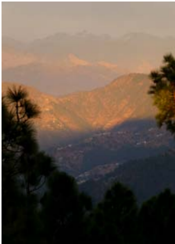
Utsikt ved Baniketh.