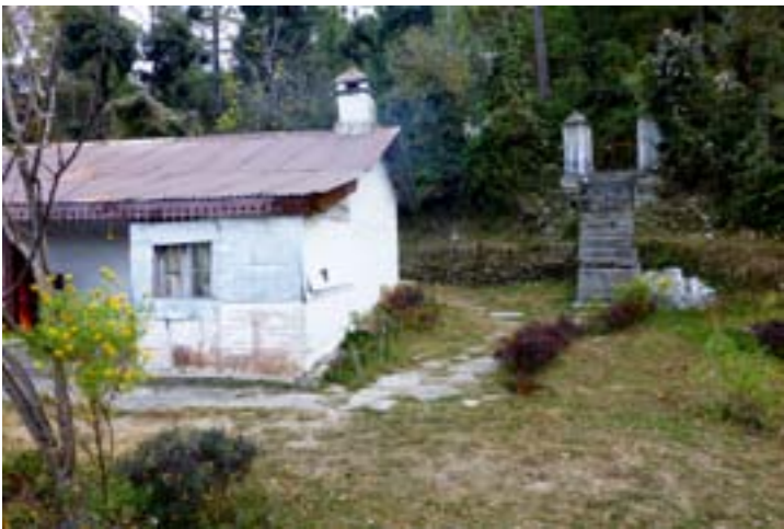
Inngangen til «Prem Ashram» ligger rett ved veien til Dalhousie, med en bratt trapp ned. Tidlig på morgenen ligger ashramen i skyggen.