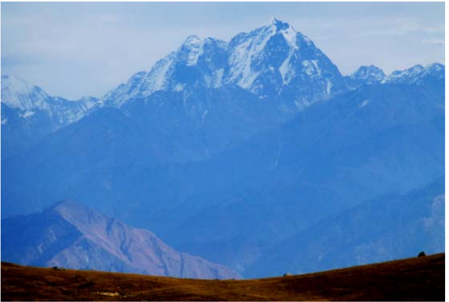
Deler av Lahul-Spiti fjellkjeden, slik den kan ses ved Dalhousie i Chamba-distriktet i det vestlige Himalaya.