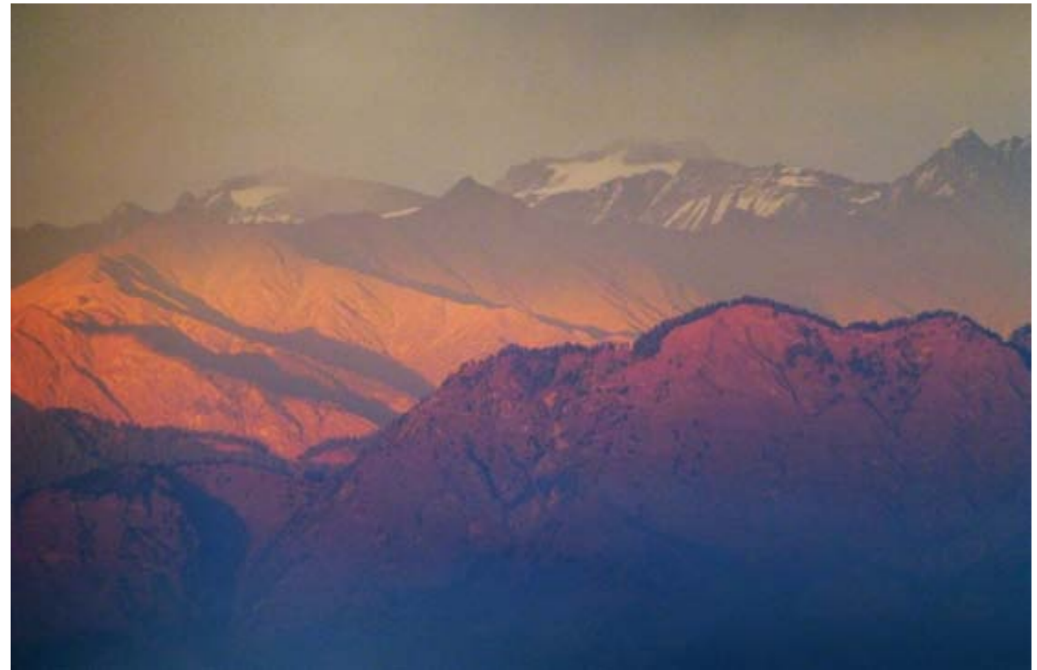
Utsikt ved Baniketh i solnedgang. Bildet er tatt 21. november 2012, ved forfatterens 2. besøk til «Prem Ashram». Ved det første besøket i juli 1989, over 23 år tidligere, var de høyeste fjellene i bakgrunnen fullstendig dekket av snø. Foto: BP.

Naturen omkring besto av en meget frodig og vakker skogstype i sonen mellom subtropisk regnskog og høyalpin furuskog, slik at det var en blanding av flere skogstyper. Fra Dalhousie var det bare ren furuskog å se oppover mot tregrensa. Over alt var det masse rodhodendron, og fuglelivet var fantastisk og fargerikt, også med den samme blandingen av arter fra forskjellige høydelag og levevilkår. Bjørner og andre ville dyr fantes det også i omegnen, og det hendte at enkelte av dem kom på besøk i ashramens frukthage nattestid. Ashramen hadde en liten hage med aprikostrær som hadde moden frukt på den tiden jeg var der, og som det var en nytelse å smake på. Det var frisk, klar luft med høy varme midt på dagen og forholdsvis kalde netter – omtrent akkurat slik jeg var vant med fra gode sommerdager i Alvdal. Nesten daglig kom det en regnskur siden monsunen nå var i anmarsj. Om vinteren pleide det ofte å komme litt snø som gjerne tinte bort i løpet av dagen.