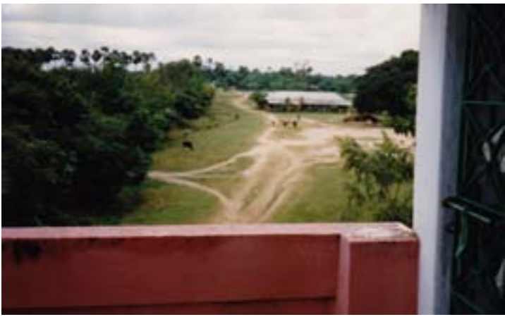
Fra taket på kontorbygningen, som nå hadde fått flere etasjer siden sist, med utsikt mot sør. Den store, åpne gårdsplassen med banyantreet (til høyre) og sykestua bak. Bak trærne i horisonten er Banagram landsby.