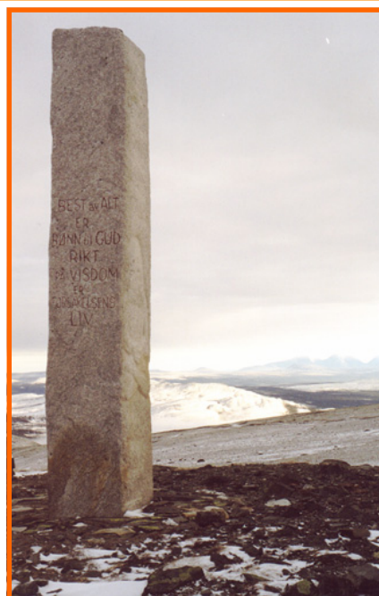
Monumentet på Flat-Tron. 15. november 1999.

Alvdal får et storslått og attraktivt prosjekt gratis og uten mye egeninnsats. Stiftelsen har vært tålmodig lenge. Nå bør kommunen ta affære!