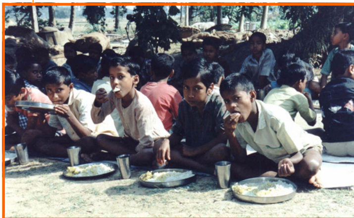
Foreldreløse barn ved Paramananda Mission, Banagram, Vest-Bengal, India. Bildene er tatt i januar 1995. Siden den gang er det bygget et stort kjøkken med spisesal for barna.