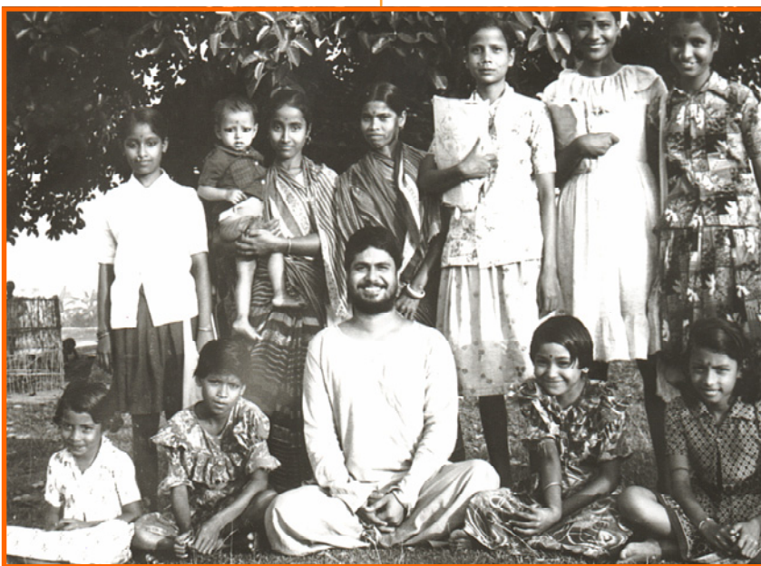
Swami Paramananda sammen med landsbybarn fra Banagram, i Paramananda Mission, oktober 1984.

De fleste voksne fastboende er dedikerte sjeler som - ved siden av sin egen åndelige øvelse, og i forsakelse av familieliv og personlig karriere - har ønsket å ofre seg helt for å hjelpe andre. De arbeider frivillig og helhjertet innen de områder som interesserer dem mest, med enkle midler under enkle forhold, og er fornøyde med å få dekket de mest grunnleggende behov. De er av begge kjønn,