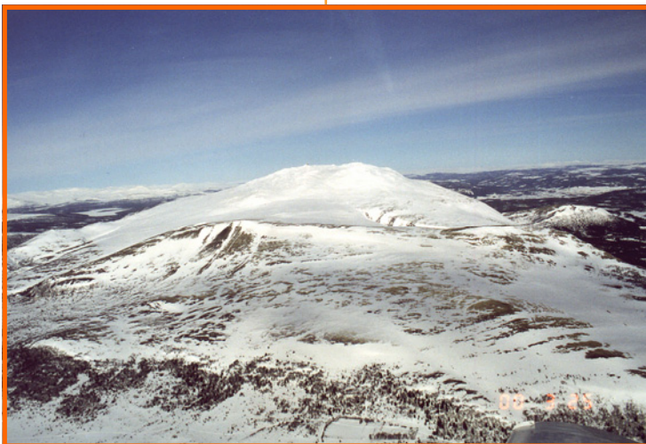
Tronfjell sett fra sør over Østkjølen, med Sjulhusvangen helt i forgrunnen. Flyfoto: BP. Pilot: Svein Ellingvåg, 25.03.00.

litteraturs møte med Østen på begynnelsen av 1900-tallet. Et av kapitlene er viet Swami Sri Ananda Acharya og hans innflytelse på svenske forfattere. Avhandlingen ventes å være ferdig ved utgangen av neste år.